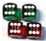
<- Präzisionswürfel, Doppler